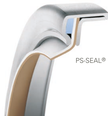
PS-SEAL® mit gedrehter Lippe